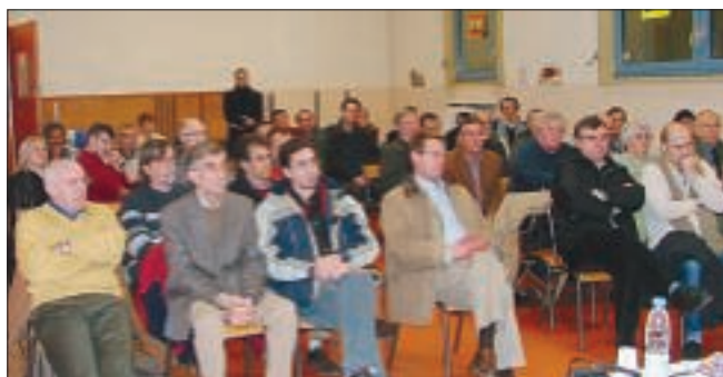
■ Les participants à l'Assemblée Générale

La journée dite de « solidarité » : elle est maintenant à négocier dans l'entreprise, mais cela reste une journée perdue pour le salarié.