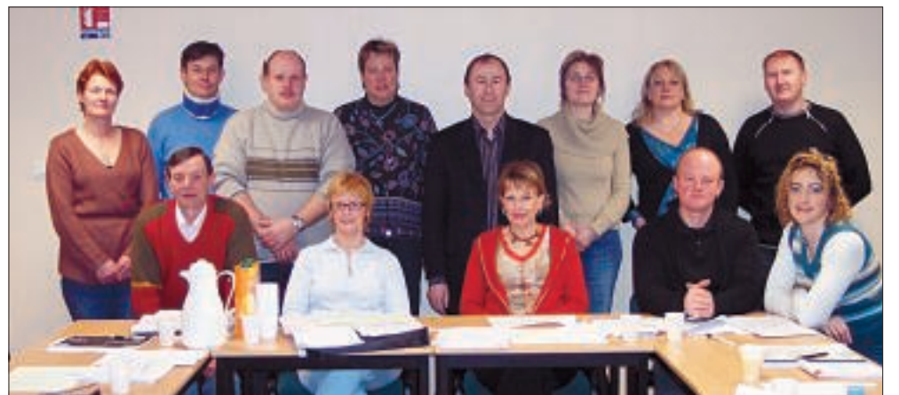
Stage CE Carrefour du 22 au 24 mars

Fax : 03 21 69 88 09 - Tél. 03 21 69 88 00