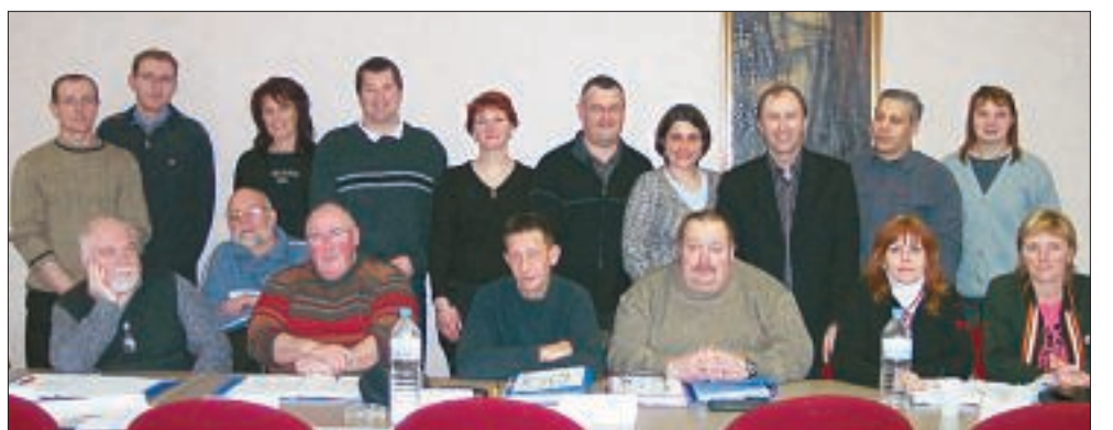
Stage CHSCT - du 20 au 24 mars