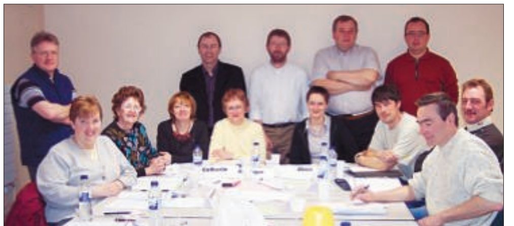
Stage Découverte FO Poste du 22 au 24 mars