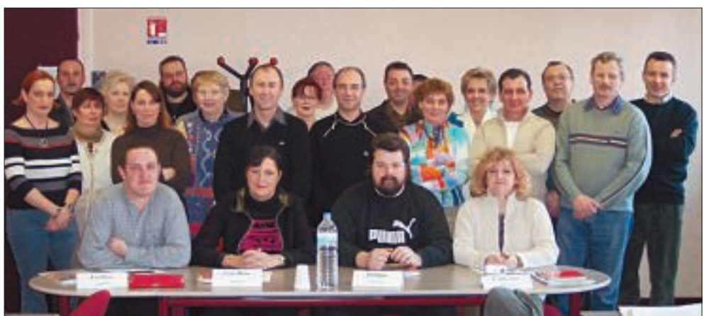
Photo prise lors du stage "Découverte F.O." qui a eu lieu du 5 au 10 février 2006