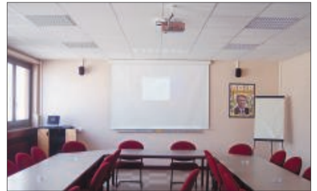
■ La salle de réunion rénovée.

Récemment la grande salle de réunion "Léon Jouhaux" a été complètement rénovée. C'est désormais un lieu très convivial, où se déroulent les réunions et les formations syndicales.