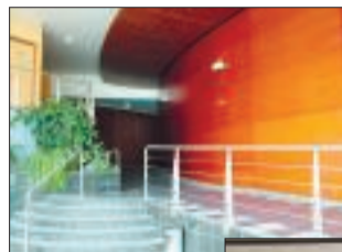
■ Le hall d'entrée